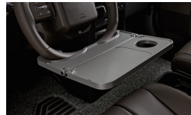
스티어링 휠 테이블