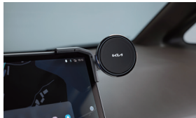
디스플레이 휴대폰 거치대