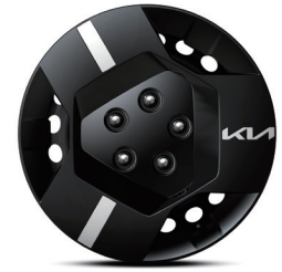
16인치 스틸 휠 (풀사이즈 휠커버 적용)