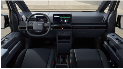
네이비 인테리어(딥 네이비)