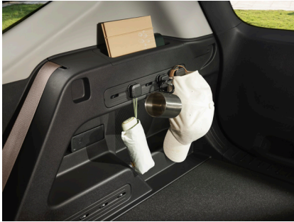
Kia AddGear 체결부