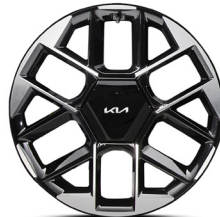
20인치 GT 전용 전면가공 휠