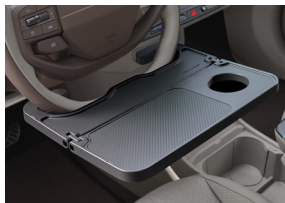
스티어링 휠 테이블