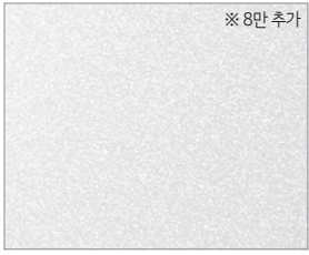
스노우 화이트 펄(SWP)