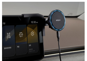
디스플레이 휴대폰 거치대