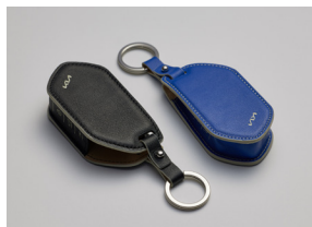
스마트키 가죽 케이스