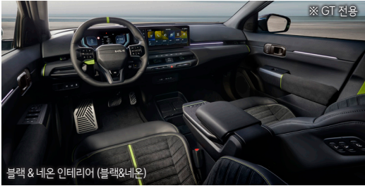
블랙 & 베이지 인테리어 (블랙&네이)