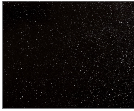
오로라 블랙 펄(ABP)